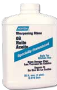
4.3392.1 Specially Formulated Pharmacopeia Grade Mineral Oil – XB5, 1 Pint Huile – Un demi-litre d'huile minérale, grade pharmacopée, spécialement formulée