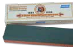
4.3391.1 India Bench Coarse / Fine Aluminum Oxide Combination Stone – IB8 (8"W X 2"H X 1"D) Pierre combinée – India Bench rugueuse et extra fine IB8 20 cm X 5 cm X 3 cm