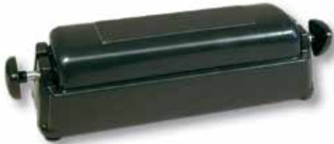
4.3393.2 1 1/2" Multi-Oilstone Honing System – IM313 (Holds Stones Measuring 1 1/2" X 2 1/2" X 1/2" ) 29 cm, système d'affûtage IM313 avec pierres à huile multiples 29 cm X 6 cm X 1 cm

Kit includes: 1 reservoir, 1 coarse crystolon, 1 medium crystolon, 1 fine India honing stone and 1 pint of specially formulated pharmacopeia grade mineral oil