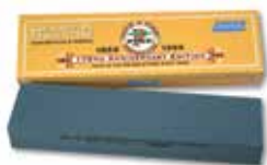
4.3391.2 Crystolon Bench Coarse / Fine Silicon Carbide Combination Stone – JB8 (8"W X 2"H X 1"D) Pierre combinée – Crystolon rugueuse et fine JB8 20 cm X 5 cm X 3 cm