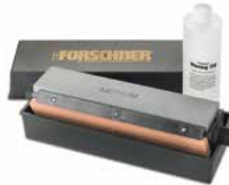
4.3391.8 Coarse Replacement for 41010 (1 1/2" X 2 1/2" X 1/2" ) Pierre rugueuse de rechange (29 cm X 6 cm X 1 cm)